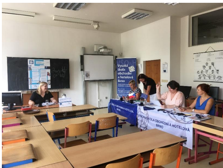
Fotografie ze zasedání

Cílem aktivity je modernizace a doplnění vybavení VŠ v prostorách využívaných pro výuku, samostudium, skupinové práce na projektech apod. Většina nákladů bude sloužit k vybavení počítačových učeben, které jsou využívány všemi studijními programy – všemi studenty.