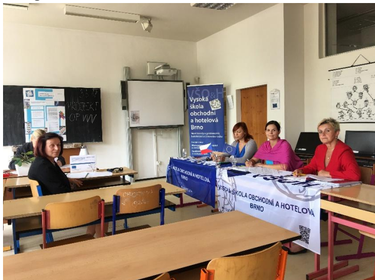
Fotografie ze zasedání